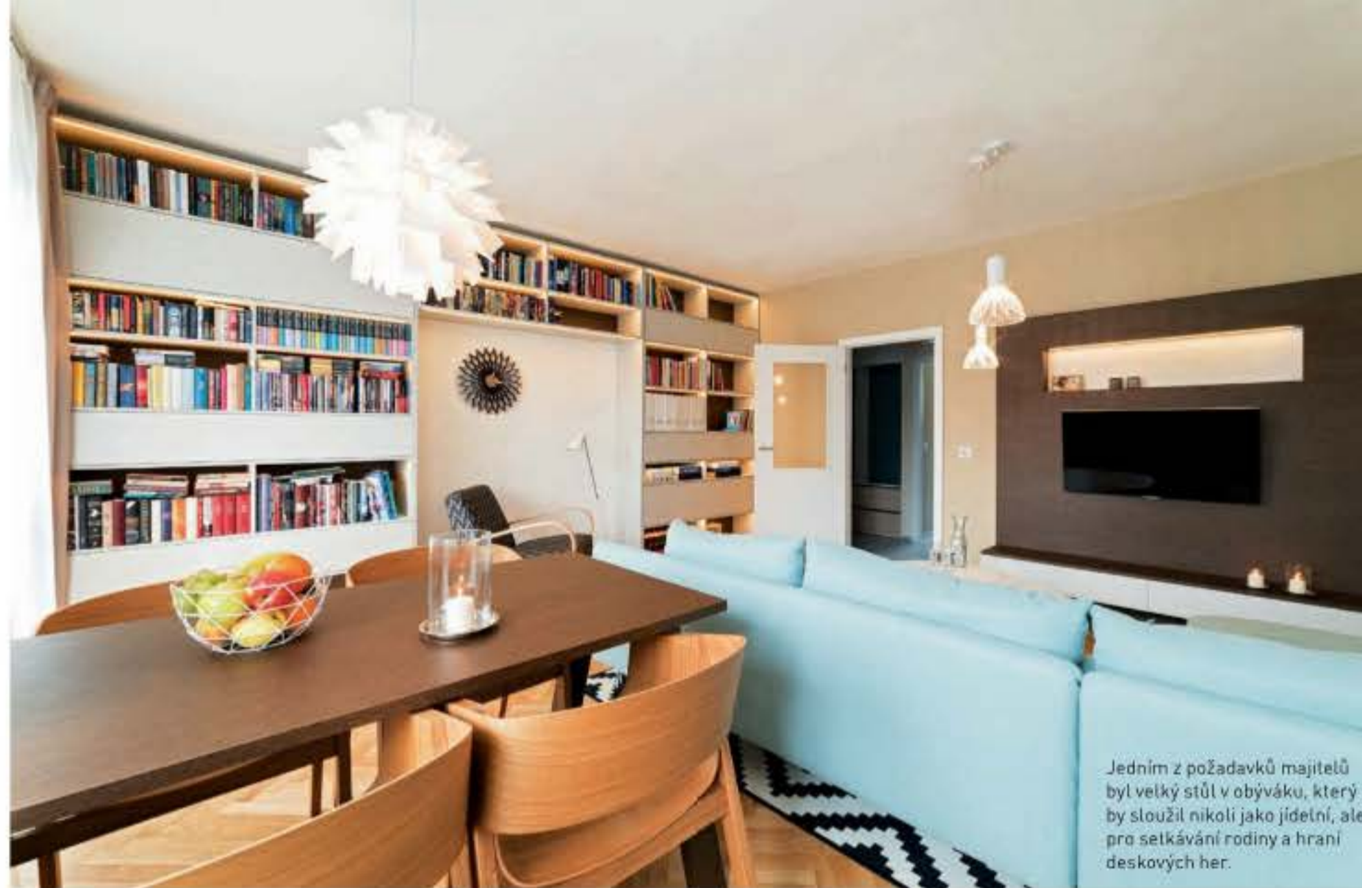
Jedním z požadavků majitelů byl velký stůl v obývacího, který by sloužil nikoli jako jídelní, ale pro setkávání rodiny a hraní deskových her.

Většinu nábytku, včetně vestavěných skříní, knihovny nebo kuchyňské linky, vyrábělo na míru stolařství