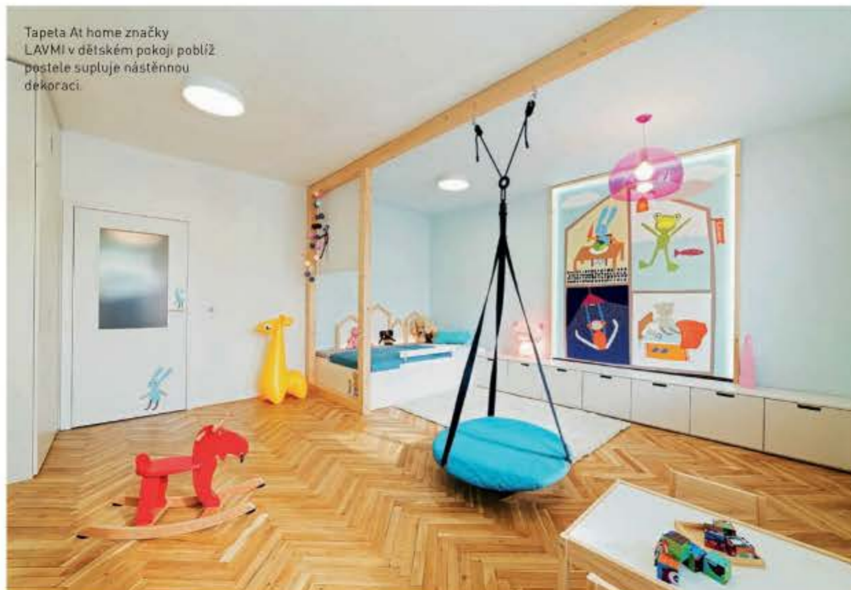
Tapeta At home značky LAVMI v dětském pokoji poblíž postele doplňuje nástěnnou dekoraci.

Přestože je byt jako celek velice velkorosý na prostor, u sociálního zázemí se muselo počítat s centimetry. Do miniprostoru koupelny se však nakonec vešly i pračka a kotel skrytý ve skřínce. Další chytrá řešení se uplatnila na toaletě, kterou zvětšila nika pro zabudované malé umyvadlo a skříňku. Ostatně systém úložného prostoru v nuce je dobře vidět i u zmiňovaných vestavěných skříní jak v ložnici, tak v chodbě. Díky tomu pak už nebylo třeba místnosti nadměrně zahlcovat nábytkem, navíc když se sezonní věci dají uložit ve sklepech, který k bytu náleží. U