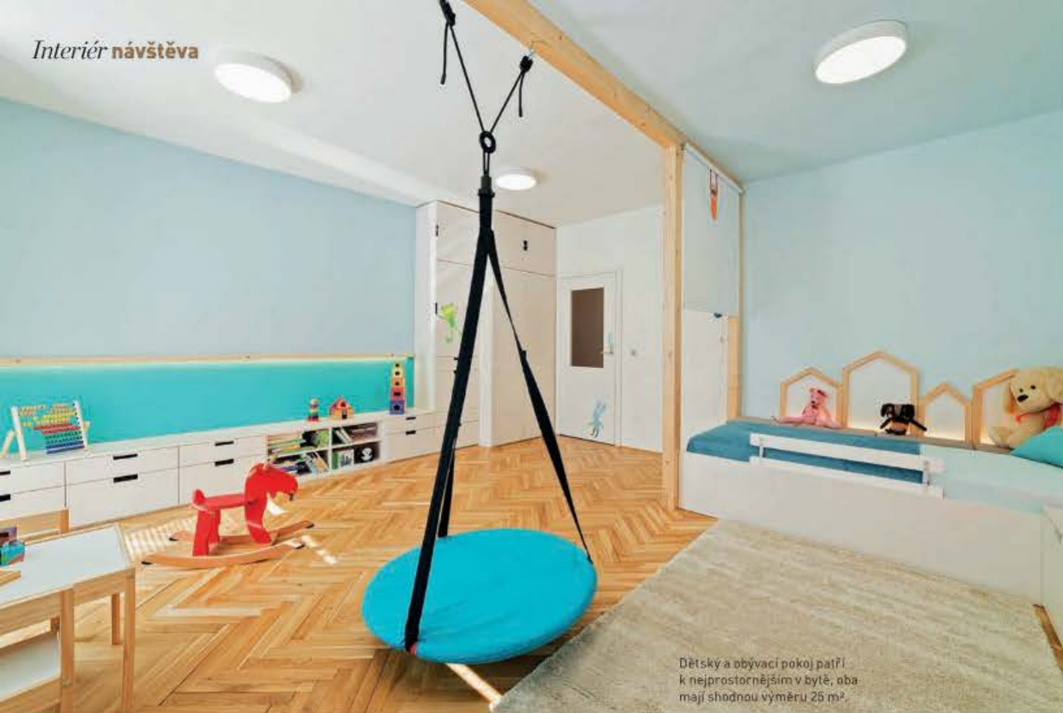
Dětský a obývací pokoj patří k nejprostornějším v bytě, oba mají shodnou výměru 25 m 2 .