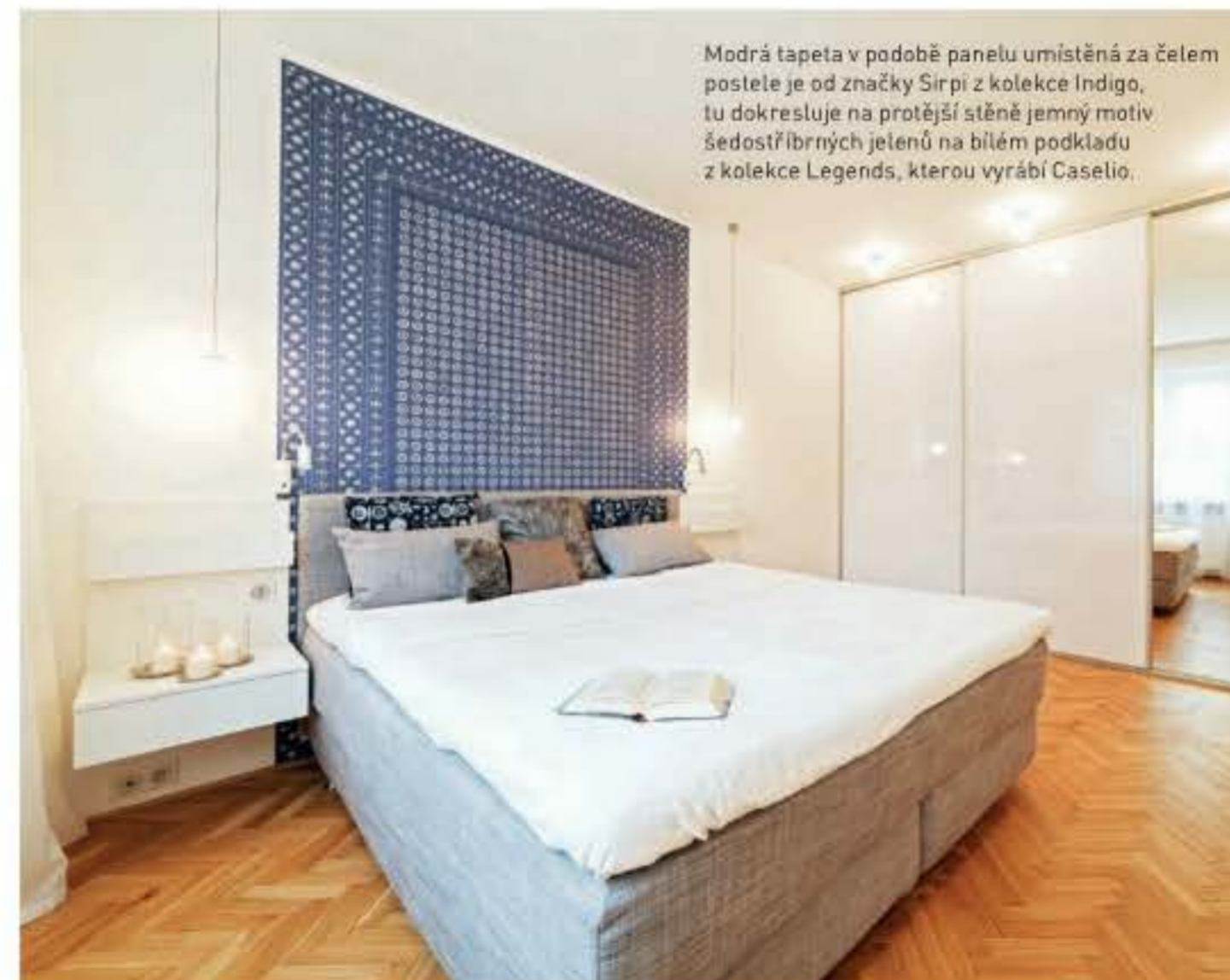
Modrá tapeta v podobě panelu umístěná za čelem postele je od značky Sirpi z kolekce Indigo, tu dokresluje na protější stěně jemný motiv šedostříbrných jelenů na bílém podkladu z kolekce Legends, kterou vyrábí Caselio.

Celým bytem se prolíná řada sjednocujících prvků, například stejný dekor dlažby použitý na chodbě, koupelně a WC.