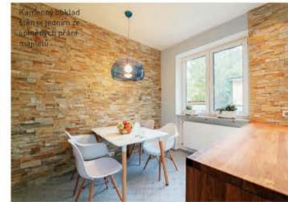
Kamenný obklad stěny je jedním ze spínečných prvků majitelů.

K bytu patří dvě ložnice, jedna u dětského, druhá u obývacího pokoje. A dále malý balkon, na který se vchází z kuchyně.