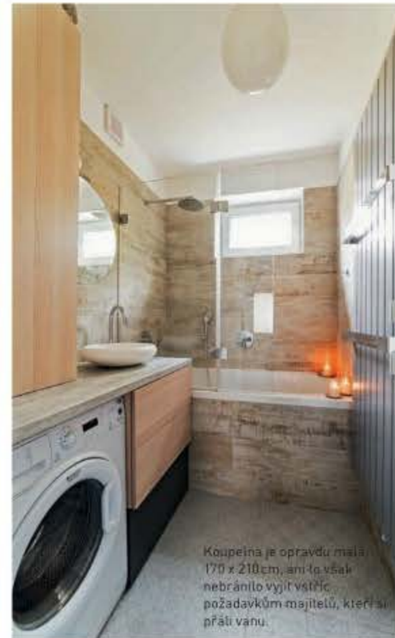
Koupeřna je opravdu malá, 170 x 210 cm, ani to však nebránilo vyjít vstříc požadavkům majitelů, kteří si přáli vanu.

Just. V bytě totiž nejsou zcela kolmé stěny, ostatně s touto skutečností se musely popasovat i další firmy, zejména AI Rekonstrukce, která řešila stavební práce, ale také výrobce interiérových dveří Sapeli.