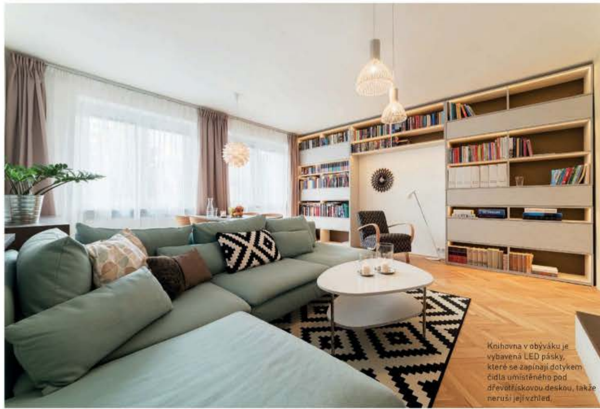
Knihovna v obývacího je vybavená LED pásky, které se zapínají dotykem čidla umístěného pod dřevotřískovou deskou, takže neruší její vzhled.