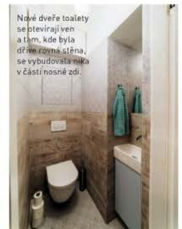
Nové dveře toalety se otevírají ven a tam, kde byla dříve rovná stěna, se vybudovala nika v části nosné zdi.

Celým bytem se prolíná řada sjednocujících prvků, například stejný dekor dlažby použitý na chodbě, koupelně a WC.