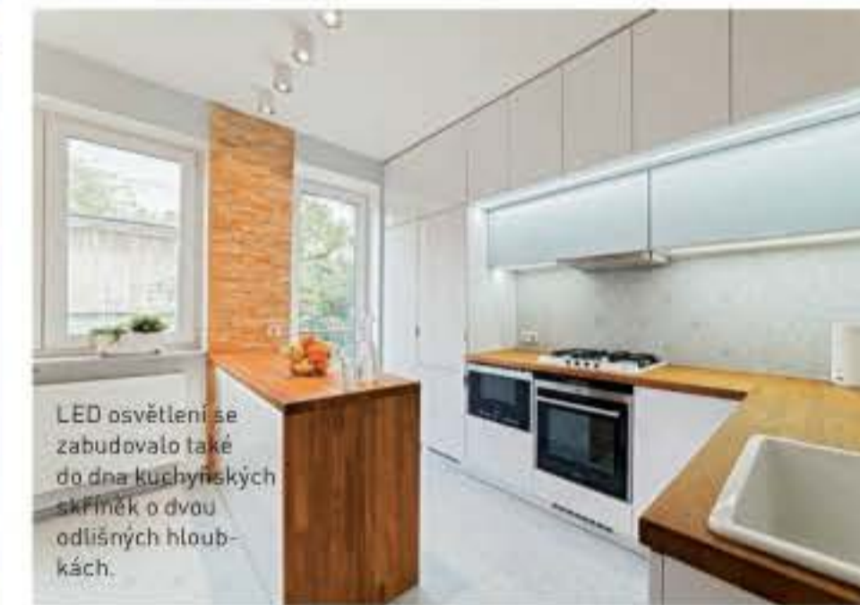
LED osvětlení se zabudovalo také do dna kuchyňských skříněk o dvou odlišných hloubkách.