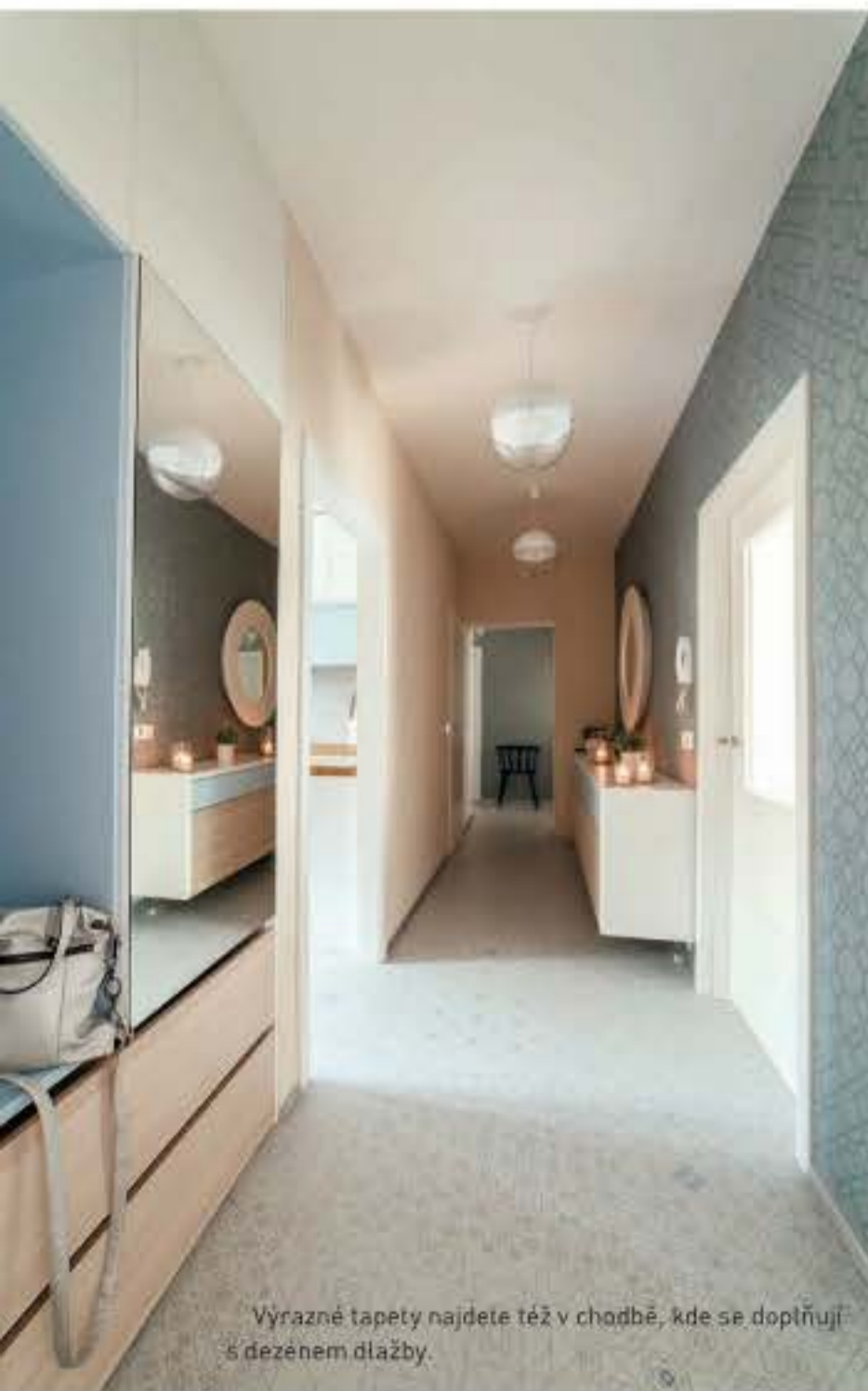
Výrazné tapety najdete též v chodbě, kde se doplňují s dezentem dlažby.