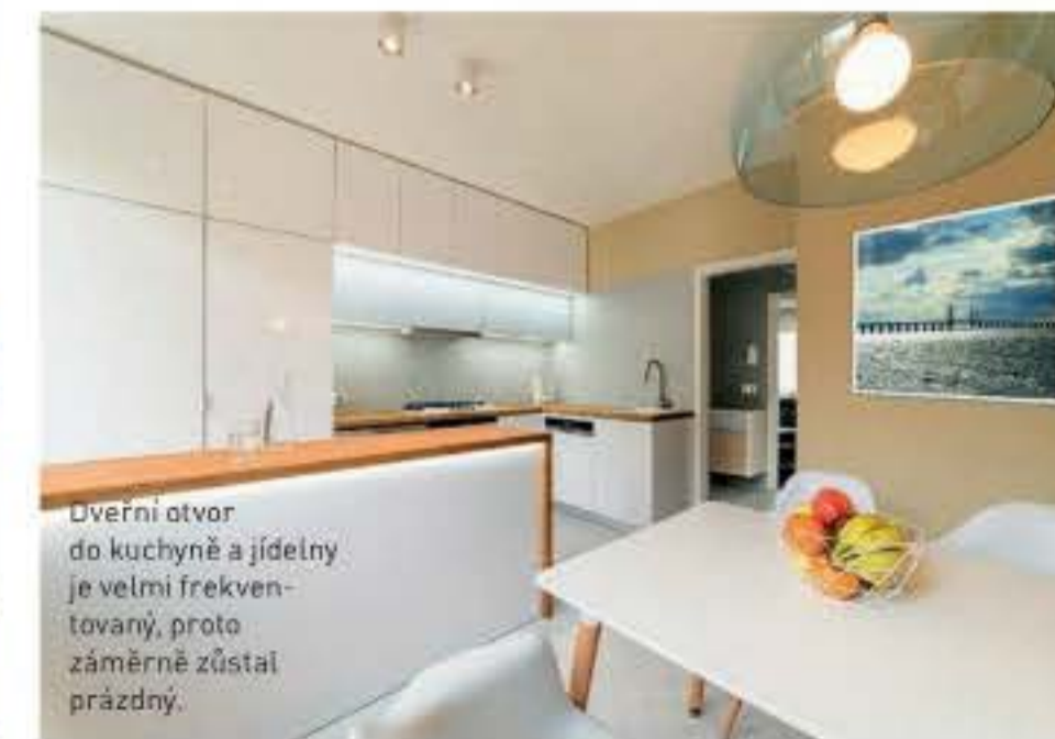
Dveřní otvor do kuchyně a jídelny je velmi frekventovaný, proto záměrně zůstal prázdný.